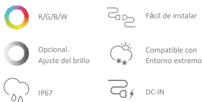
Tabla de parámetros.