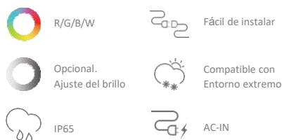
Tabla de parámetros.