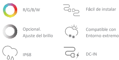
Tabla de parámetros.